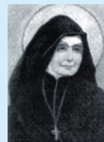
Santa Vicenta María

Sus actividades se desarrollan en un Centro Social , donde se acoge, orienta a forma a las personas (principalmente Jóvenes) que vienen en busca de trabajo y ayuda de todo tipo. En su mayoría son emigrantes, que vienen de paso o están afincadas en la Ciudad de Zaragoza. La Residencia de Jóvenes se dirige a jóvenes que tiene que desplazarse de sus domicilios familiares, para poder realizar unos estudios que les preparen y capaciten para un puesto de trabajo en la sociedad, o que comienzan su primer trabajo. La mayoría son estudiantes de la Universidad de Zaragoza. Un grupo menor estudia Carreras Medias y Ciclos Formativos. Proceden de Aragón, La Rioja, Navarra, Cataluña y de otras comunidades de España. También acogemos a Jóvenes de otros países: Portugal, Francia. Además de darles acogida y tratar de cubrir sus necesidades básicas, se lleva adelante una labor Pastoral de educación y formación integral.