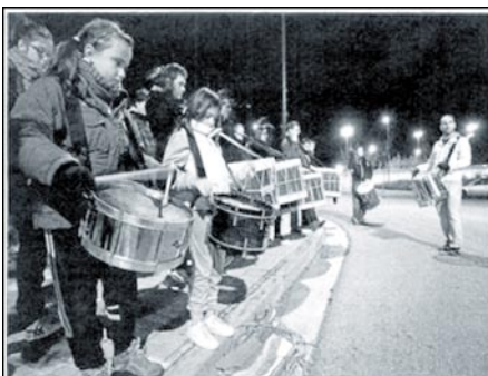
Los primeros ensayos ya están en marcha

Por delegación de la Junta de Gobierno y para preparar como se merece esta celebración se constituyó en enero de 2011 una Comisión de ocho miembros, con la responsabilidad de planificar y organizar todos los actos conmemorativos de esta efeméride. Está a disposición de los cofrades para conocer sus ideas, compartir recuerdos, trasladar comen-