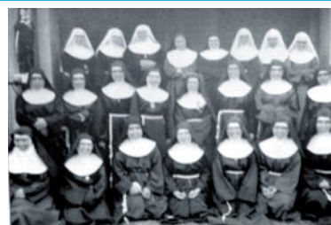
Imagen de la comunidad de Basilan en la profesión perpetua de una monja (en el centro, con la corona de espinas sobre la cabeza).