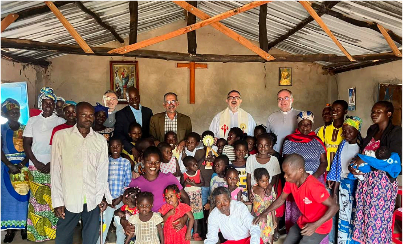
Capilla dedicada a la Virgen del Pilar en Malanje.