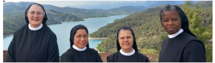
COMUNIDAD DE AUXILIARES PARROQUIALES

E l grupo scout comenzamos con mucha ilusión y estamos preparados para empezar. Lo tenemos muy fácil dentro de esta familia de Santa Engracia donde a través de actividades y celebraciones nos acercamos un poquito cada día a Dios. Tenemos muchos niños esperando el día de comenzar y estoy seguro de que vamos a disfrutar de un año lleno de aventuras, campamentos, servicio y experiencias como siempre en nuestra parroquia.