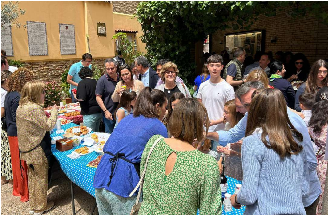
Convivencia de la parroquia en junio... como una familia