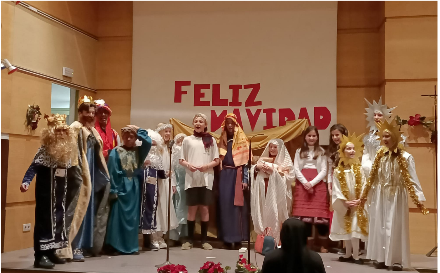
Belén viviente realizado por los chavales de postcomunión.