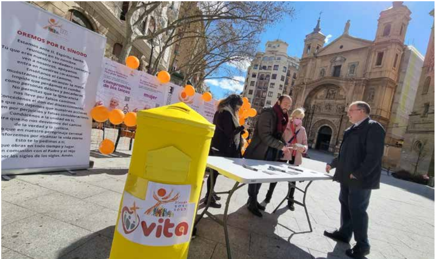
El sínodo en la calle. Numerosas personas y familias se acercaron al stand informativo y dejaron sus propuestas.