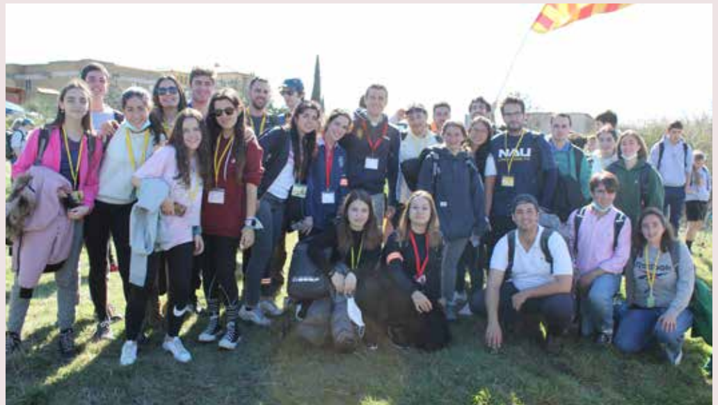
Grupo de jóvenes de nuestra parroquia en la Javierada.

Al llegar comenzamos con alguna actividad para conocer al resto de los jóvenes con los que íbamos a recorrer juntos el camino y la jornada. Durante la ruta nos repartieron unas preguntas para reflexionar y dinámicas con el objetivo de descubrir que estábamos peregrinando con un sentido de fe, y que no éramos simples viajeros. Hicimos un alto en el camino en la parroquia de Liédena para gozar de una oración encomendándonos al Señor y retomamos el camino hasta Sangüesa, donde comimos disfrutando del maravilloso día soleado que había amanecido. Ya algunos comen-