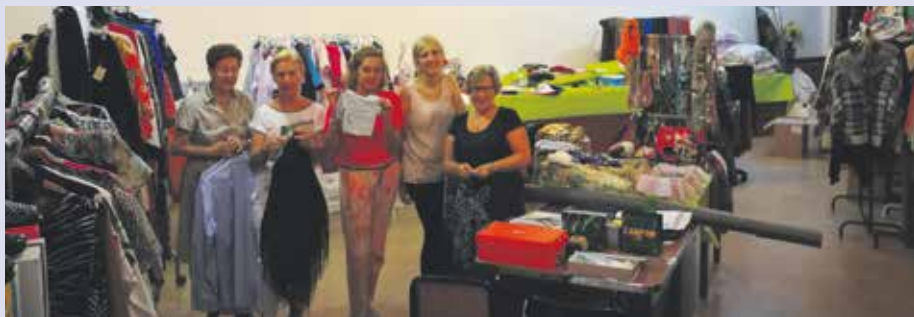
Voluntarias en la edición del rastrillo 2018.

Podemos colaborar con esta iniciativa solidaria visitando y adquiriendo objetos del rastrillo y, ¡cómo no!, ayudando en su organización. Podéis hacerlo contactando con las representantes parroquiales de Manos Unidas. ¡Os esperamos en el rastrillo!