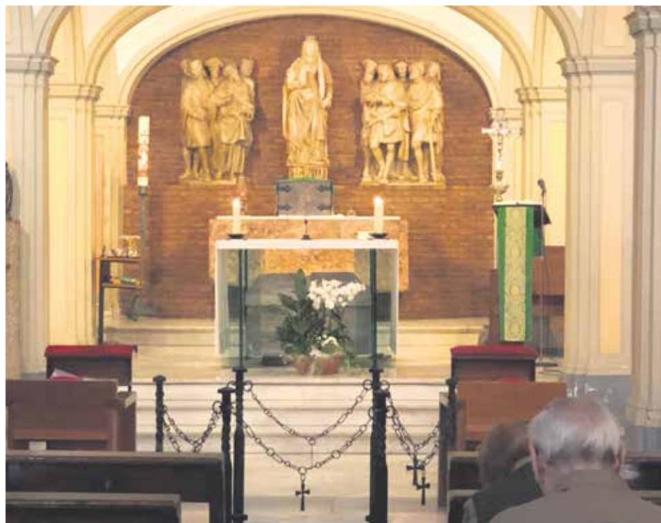
Cripta de Santa Engracia.

Casi 600 años. Se dice pronto. Porque en esta ciudad bimilenaria, donde se han mezclado culturas diversas, el agradecimiento de sus ciudadanos y, también, de las instituciones públicas hacia aquellos que han forjado su historia hasta dar la vida por sus firmes convicciones, por la fe; pero también hacia aquellos que defendieron con valentía los derechos de las personas que la habitaban contra intrusiones externas y ajenas, ha sido una constante casi incesante.