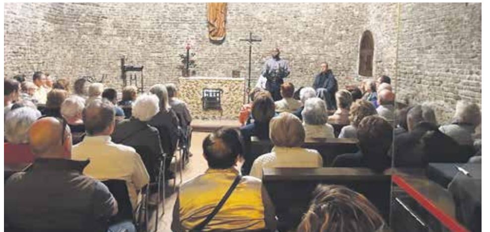
Vigilia de oración en la capilla de las Santas Masas.