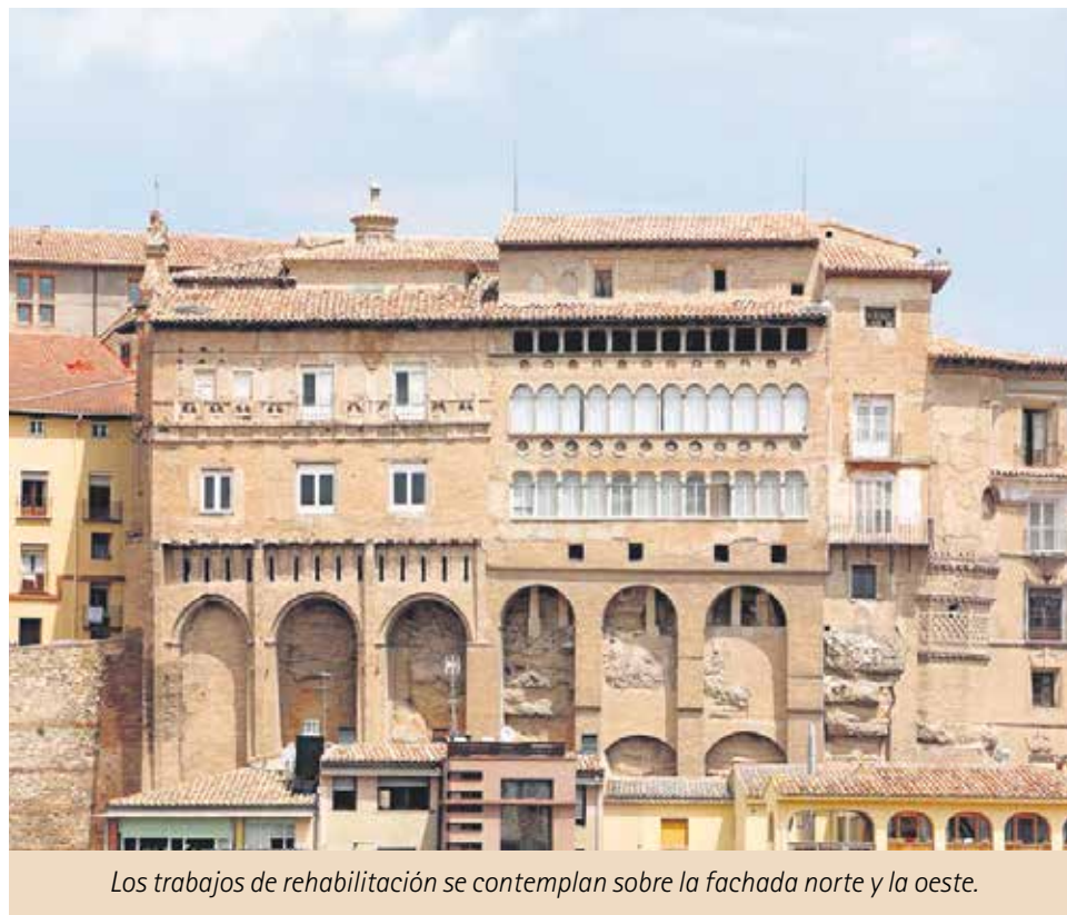
Los trabajos de rehabilitación se contemplan sobre la fachada norte y la oeste.

El Palacio Episcopal de Tarazona está abierto todos los fines de semana, mañana y tarde