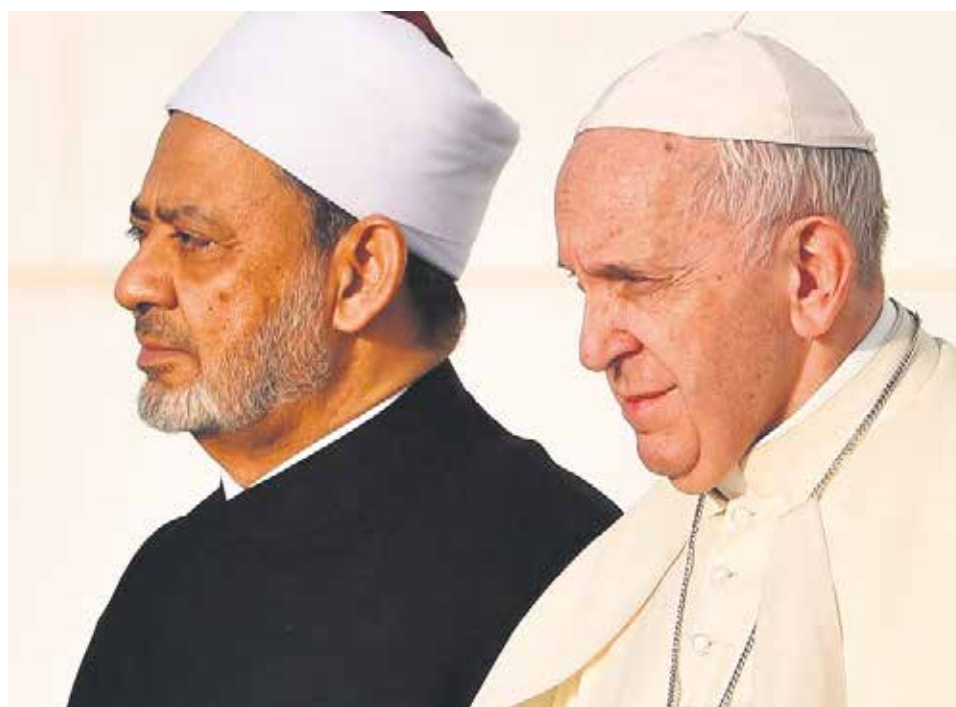
El documento supone una vigorosa defensa de la vida humana y su dignidad.

El texto comienza con una serie de invocaciones: el Papa y el Gran Imán