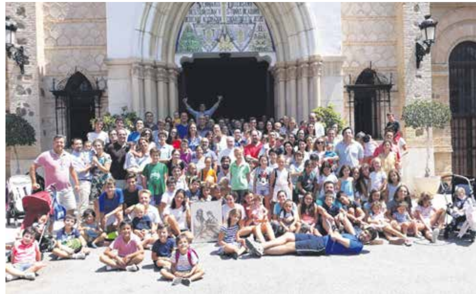
Familias del máster en el encuentro del pasado verano en Málaga.

Entonces le explico a mi compañero sorprendido: "Este master es una especialidad universitaria en Pastoral Familiar ideado por el Pontificio Instituto Teológico Juan Pablo II para Ciencias del Matrimonio y de la