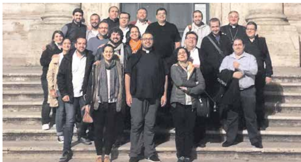
El Consejo Nacional de Pastoral Juvenil de la Conferencia Episcopal, en Roma.

Impresionan los gestos del papa Francisco. Estuvo presente en todas las sesiones: tres horas y media por la mañana y las mismas por la tarde. En la merienda se mezclaba con nosotros y hablábamos.