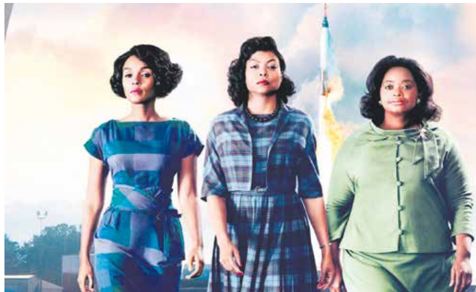
La primera película será 'Figuras ocultas'.

Antes y después de la proyección, el presentador de cada película ofrecerá