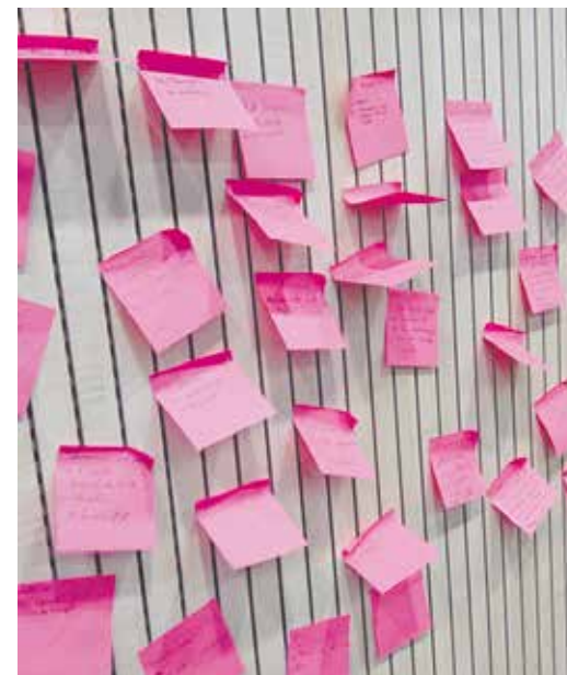
Las dinámicas de trabajo fueron variadas.

curso y está dejando evidencia de las posibilidades y oportunidades de servicio que permite ampliando las opciones de atención y formación del CRETA a nuestras diócesis y ciudadanos.