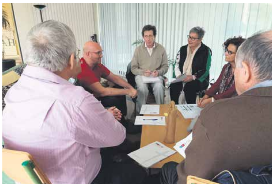
Los grupos de trabajo facilitaron la participación.

La formación online empieza su andadura en este centro con este