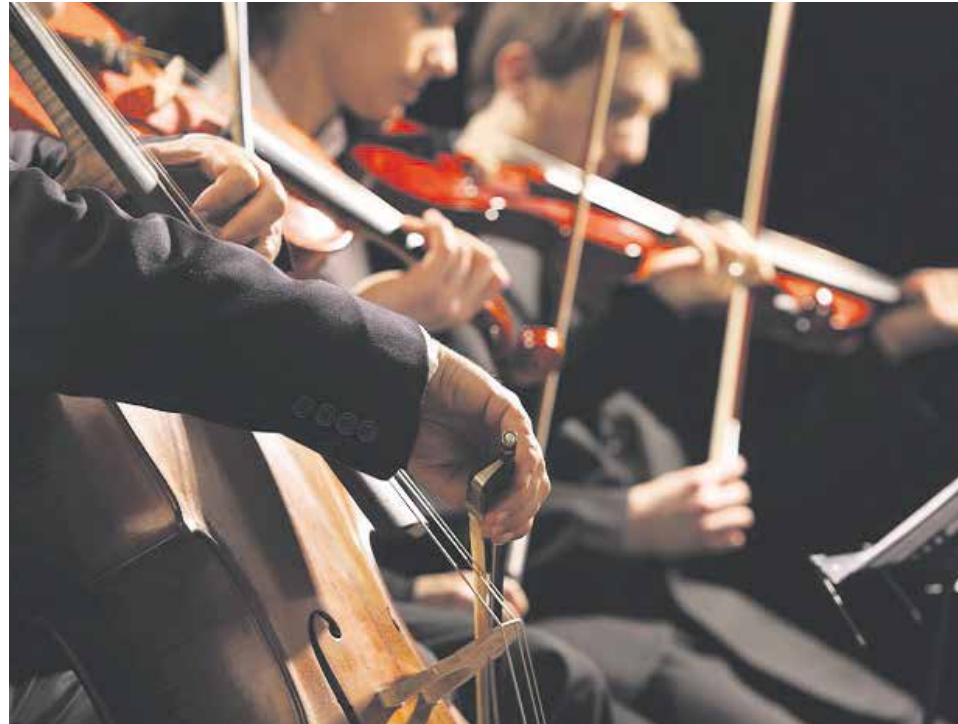
Los conciertos educativos marcan también el nuevo año.

La renovación de los conciertos educativos supuso el año pasado un "via crucis" marcado por el acuerdo de presupuestos entre PSOE y Podemos, por el que se proponía la reducción de un significativo número de unidades en centros concertados. Dicho planteamiento respondía a un axioma ideológico que considera que la escuela concertada tiene carácter de subsidiaria respecto de la escuela pública, del tal forma que aquella solo debe existir en la medida en que ésta no alcance a cubrir las demandas de plazas escolares por parte de las familias. Toda una declaración de intenciones en contra de la libertad de enseñanza y en pro de un pretendido monopolio educativo sobre la premisa de un modelo de escuela única, pública y laica, que ha sido rechazado por los Tribunales.