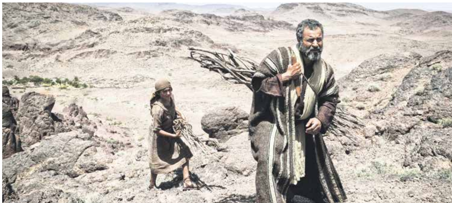
Abrahán es, posiblemente, la figura más existencial que aparece en la Escritura.

Como se describe en el relato del Génesis (Gn. 3, 1-24), el diablo introduce dentro del corazón del hombre una sospecha: "Si no puedo comer del árbol que está en medio del jardín, en el fondo es como si no pudiera comer de ninguno de los árboles". Trasladada la propuesta a la vida del enfermo, resultaría de la siguiente forma: "Si no puedo andar porque debo pasar el resto de mi vida en una silla de ruedas o postrado en una cama, en realidad es como si no pudiera hacer nada".