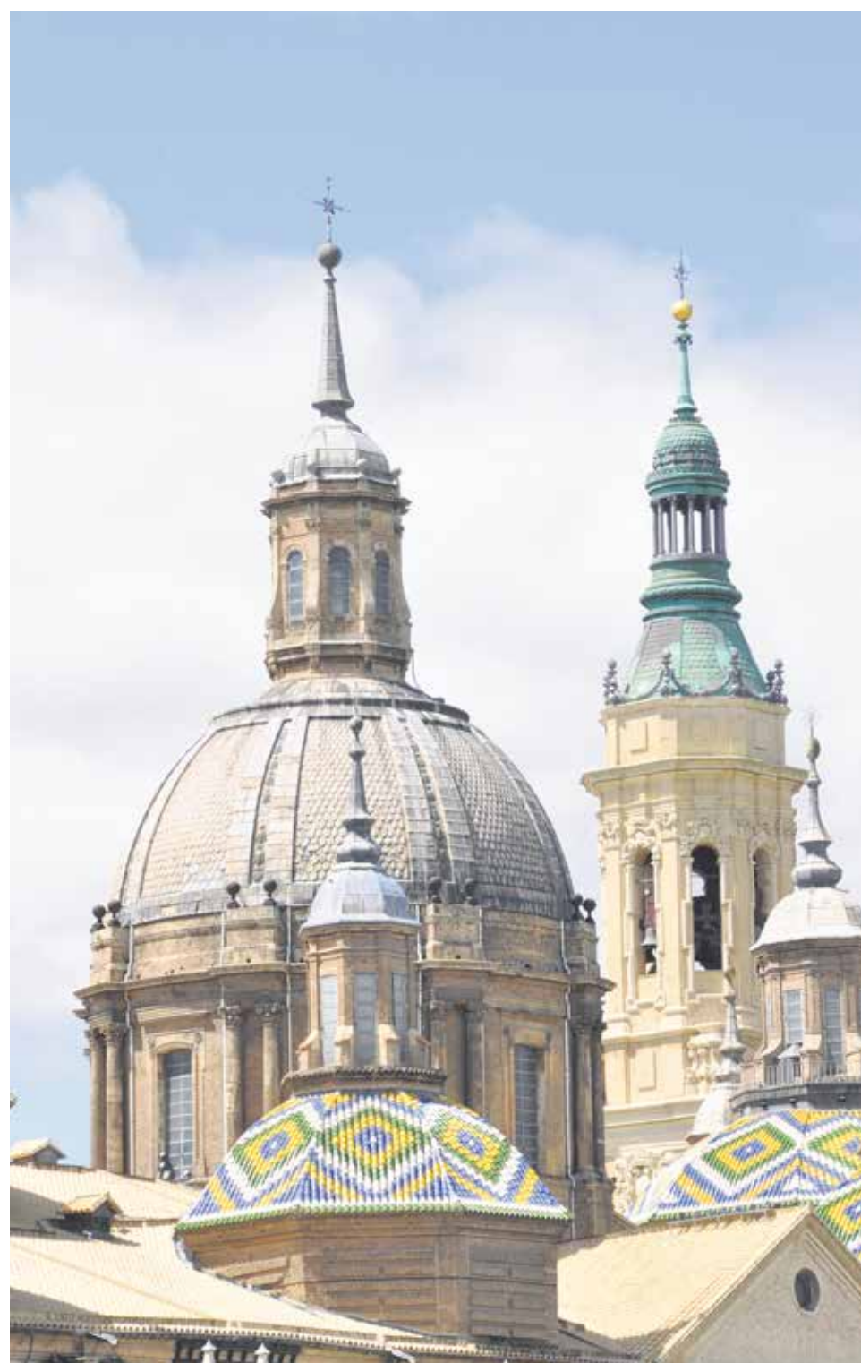
La Iglesia de Zaragoza fue elevada a archidiócesis en 1318.