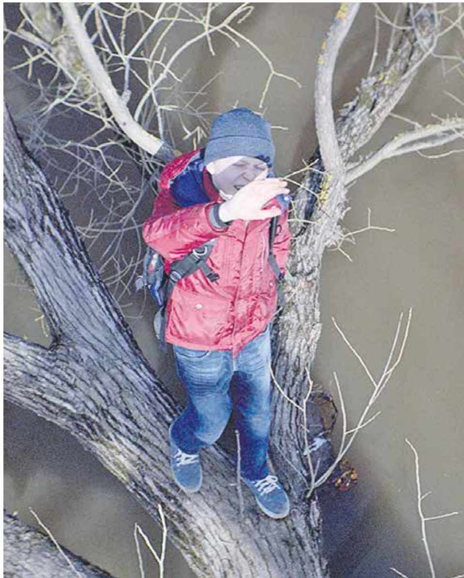
Una escena de la película 'Loveless'.

"Loveless" es una película que habla de la ausencia (de amor, de afecto, de sentimiento), pero también de las carencias personales en nuestro mundo actual. Aunque situada en Rusia (algo que le perjudica, al condicionar a la opinión pública hacia una visión política de la historia), su conflicto es extrapolable a cualquier país occidental. Los personajes principales son incapaces de mirar a su alrededor y se han desprovisto de cualquier capacidad afectiva. Solo están pendientes de lo que dicen los demás de ellos, de la imagen que proyectan (habitualmente a través de las redes sociales), y están marcados