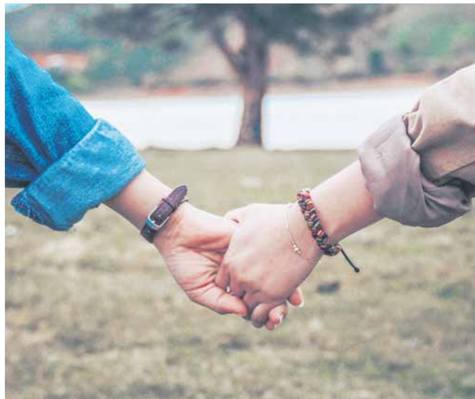
La Iglesia llama a responder con generosidad a los desafíos migratorios del siglo XXI.

Proteger: Este verbo “se conjuga en toda una serie de acciones en defensa de los derechos y de la dignidad de los emigrantes y refugiados, independientemente de su estatus migratorio. Esta protección comienza en su patria y consiste en dar informaciones veraces y ciertas antes de dejar el país, así como en la defensa ante las prácticas de reclutamiento ilegal. En la medida de lo posible, debería continuar en el país de inmigración, asegurando a los