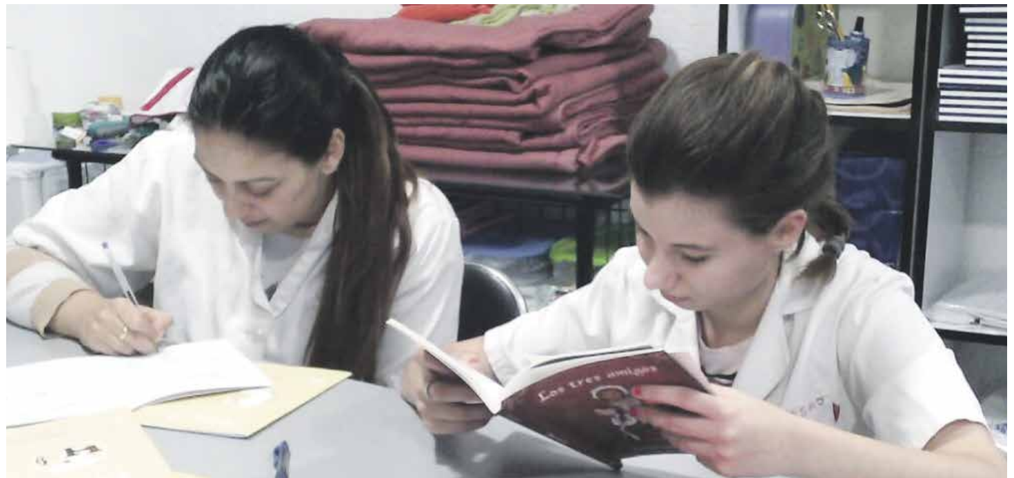
El programa de Cáritas Tarazona beneficia actualmente a seis mujeres.