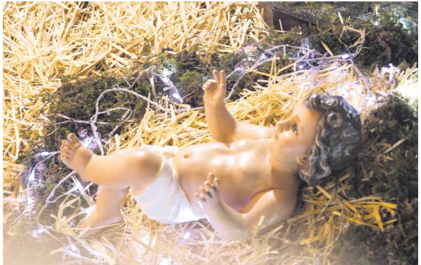
"Invitaré a mis hijos a que miren el niño del Belén con ojos agradecidos".

Tal vez, entonces, nosotros mismos, los cristianos, hemos sido los primeros que