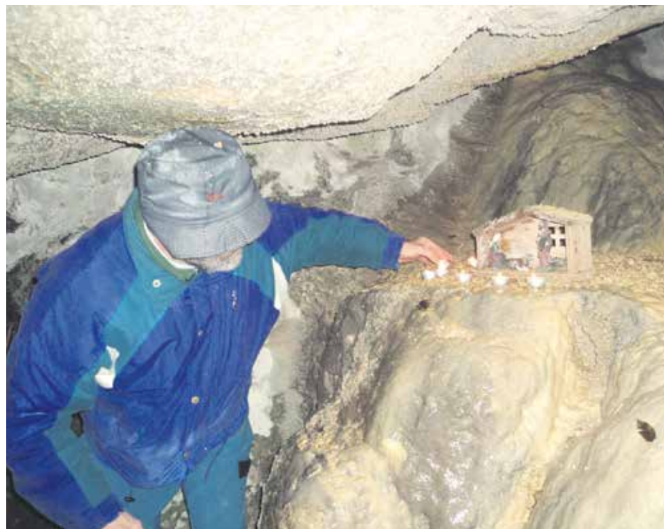
Belén montañero en la cueva de Santa Elena.

El belén encierra múltiples valores: es la manifestación del amor divino a los hombres, nos muestra la sencillez como estilo de vida y su montaje es un momento para celebrar e la alegría de la Navidad. El Belén Montañero cumple estos tres valores. Con frecuencia se organiza en lugares accesibles para que puedan asistir incluso familias con niños pequeños o gente de mayor edad. Normalmente se instala el belén debajo de una pequeña oquedad o entrante de la roca, para que quede resguardado, simulando