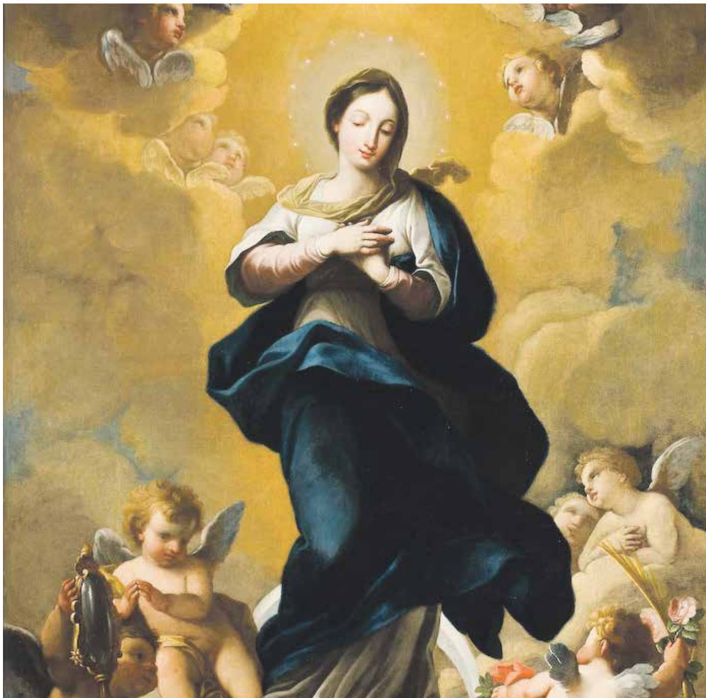
Solemnidad de la Inmaculada Concepción de la Bienaventurada Virgen María- 8 de diciembre

'La Inmaculada Concepción' (óleo sobre lienzo, segunda mitad del siglo XVIII) ubicada en la iglesia de San Gil de Zaragoza.