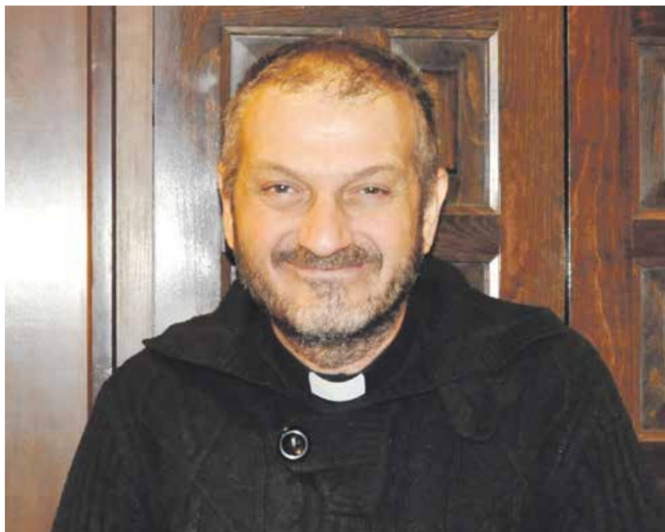
El padre Mourad sonríe en la sacristía de la basilica de Santa Engracia.

Vi esta experiencia como una gracia porque comprendí muchas cosas a nivel espiritual, a nivel humano, incluso político. Esta experiencia me permitió comprender el Daesh y todo lo que surge de ahí. Eso me permitió dar testimonio de todo el mal que el pueblo sufre, y ver que nosotros, la Iglesia, somos responsables directamente de todo el mal que sufre el pueblo sirio. Si somos testigos, si queremos ser la imagen de Cristo, ser la continuación de la encarnación de Cristo, entonces