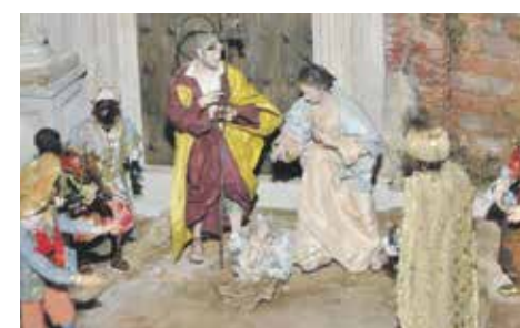
Preparando la Navidad

El belén, catequesis para crecer en familia