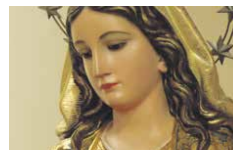
Novena en Santa Engracia