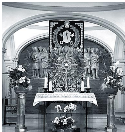
24 Horas para el Señor