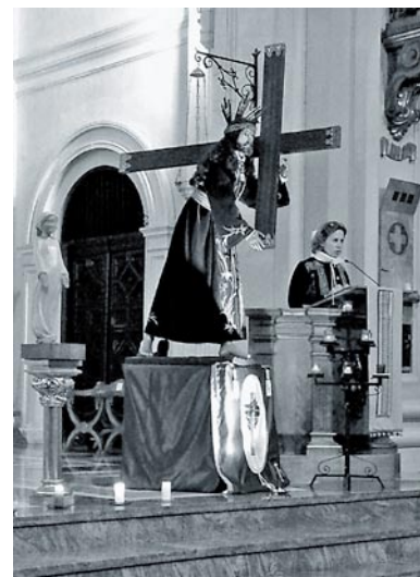
Rosario de la Jornada por la Vida