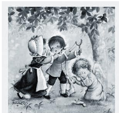
Dar buen consejo a quien lo necesita