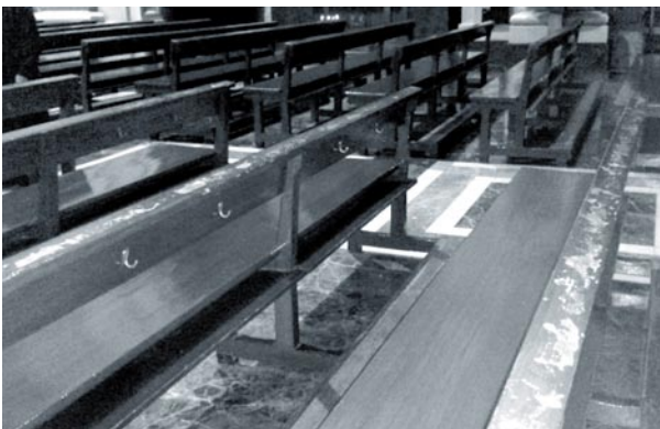
Bancos infectados de graffiti

Le agradecemos el tiempo que semanalmente nos dedica.