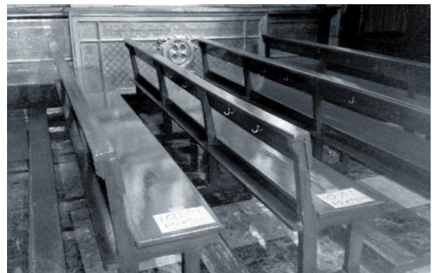
Bancos en cuarentena