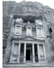
El Tesoro. Petra

La Parroquia está preparando una peregrinación a Tierra Santa.