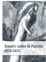
Sínodo sobre la Familia 2014-2015

Este domingo comienza la XIV Asamblea General Ordinaria del Sínodo de los Obispos, que se prolongará hasta el domingo 25.