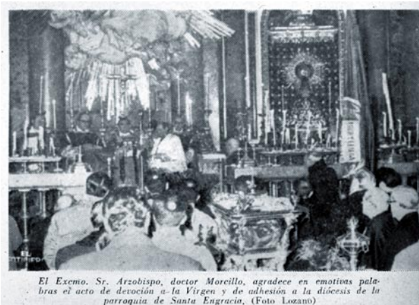
El Excmo. Sr. Arzobispo, doctor Morcillo, agradece en emotivas palabras el acto de devoción a la Virgen y de adhesión a la diócesis de la parroquia de Santa Engracia.

Fotografías de la peregrinación de 1956 publicadas en la revista El Pilar