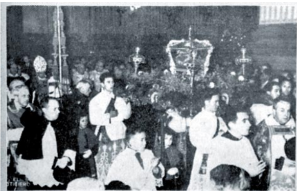
La solemne procesión, con las Santas Masas, a su entrada en el templo del Pilar.

Así lo hicieron las parroquias del 19 al 22 de mayo, del 24 al 26 y los días 28, 29 y 31. El día 20 correspondió acudir a Santa Engracia y a las parroquias de Torrero (San Francisco de Asís, Nª Sª de la Paz, Sagrada Familia, Buen Pastor y San Eugenio). En total; “más de 12.000 fieles tomaron parte en estos piadosos actos, a pesar de celebrarse en días laborables, y tanto el Rosario de la Aurora por las calles como en la Santa Misa en el Pilar reinó el mayor fervor”. (Cf. BEOAZ 1965, 413-414 y 440).