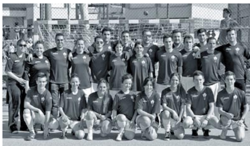
Dos maneras de celebrar un día de fiesta: de excursión o jugando al fútbol

porales, se visitó su Museo Parroquial, se tuvo una comida fraterna y se visitó el Museo de la Pastelería Manuel Segura. Todo ello posibilitado por la amable colaboración de las Auxiliares Parroquiales que cuidan de la Colegiata y de los dueños de dicho establecimiento, que explicaron con detenimiento el funcionamiento de la maquinaria antigua con la que se elaboraban dulces, caramelos, etc.