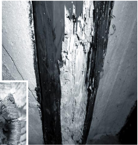
Estado de las vigas en noviembre de 2013

RECORDAD: HOY, PRIMER DOMINGO DE MES, COLECTA EXTRAORDINARIA PARA EL PAGO DE LAS OBRAS DE LA PARROQUIA