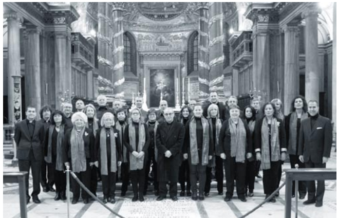
La Coral en Sta. María la Mayor con el cardenal Santos Abril