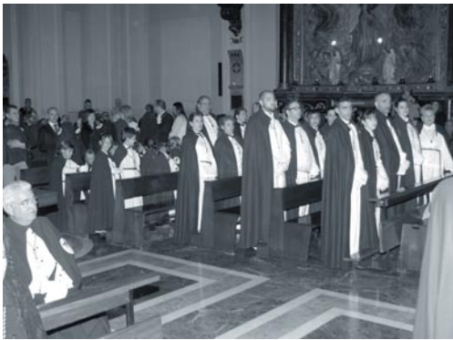
Los nuevos cofrades