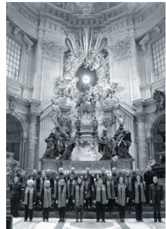
La Coral en San Pedro