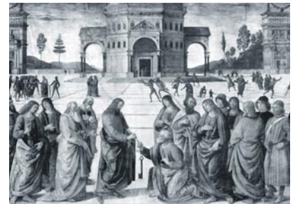
Cristo entrega las llaves a San Pedro.

Podemos utilizar una oración tradicional por el Santo Padre: " Oremus pro Pontifice nostro Francisco: Dominus conservet eum, et vivificet eum, et beatum faciat eum in terra, et non tradat eum in animam inimicorum eius. Amen ", esto es, "Oremos por nuestro Papa Francisco: El Señor lo conserve y le guarde, le de larga vida y lo haga dichoso en la tierra y no lo entregue en manos de sus enemigos. Amén".