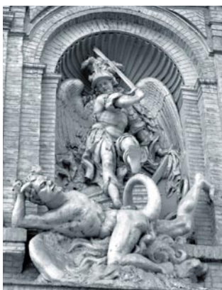
San Miguel Arcángel. Portada de su iglesia en Zaragoza

Existe pues —frente a Jesús; frente al hombre— un poder misterioso, con rasgos personales. Sin embargo, ser persona supone siempre una relación positiva con otro, una