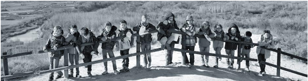
Excursión al Galacho de Juslibol

Buena Caza y Largas Lunas. Grupo Scout Santa Engracia 649