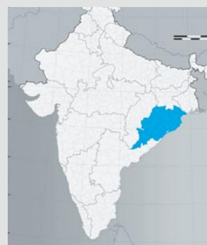
Situación del Estado de Orissa en la India