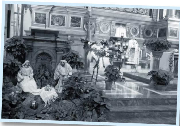
Nacimiento a los pies del ambón