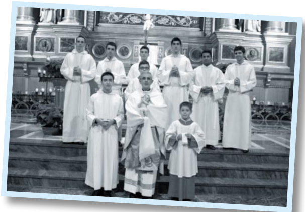
El párroco y algunos escolanos y antiguos miembros de la Escolanía al final de la Misa del Gallo