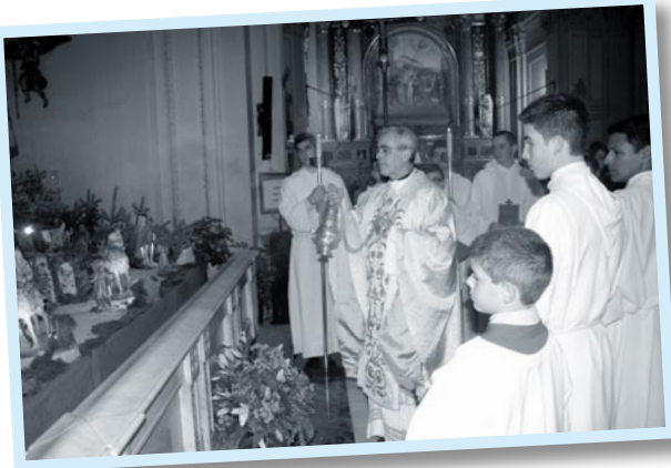
Bendición del belén en la Misa del Gallo