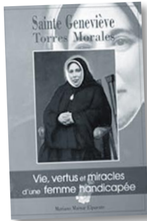
Portada de la edición francesa del libro sobre Santa Genevieve (2006)