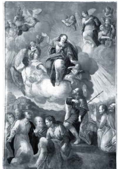
Representaciones de la Venida de la Virgen. Basílica Parroquia de Santa Engracia.