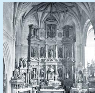
Iglesia de Uztarroz: exterior y retablo mayor.