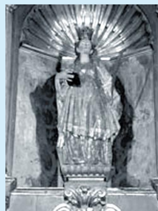
Santa Engracia de Olite

También existieron cofradías de San Lamberto en Sangüesa y Pamplona. En aquella villa los labradores veneraban a la Virgen del Socorro en su ermita. En 1596 nombraron como santo protector a San Lamberto. El número de hermanos cofrades osciló, según las circunstancias y en el siglo XVIII se acercaba a los doscientos. Además de los actos