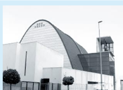
Vista exterior de la nueva parroquia de Sarriguren

En la diócesis de Pamplona da el nombre a cuatro iglesias parroquiales en Lacar-Eguarte (merindad de Estella, 62 h en 2013, con fiestas menores a la santa el sábado anterior al 16 de abril), Sagaseta , (a 10 kilómetros de Pamplona, es del siglo XIII y el retablo mayor de fines del XVI; 35 h.; las fiestas se han trasladado al primer fin de semana de agosto en este pueblo las fiestas en su honor), Uztarroz (valle del Roncal, merindad de Sangüesa, con 166 h; un dicho afirma “Santa Engracia que es gentil, décimo sexto de abril, aunque toque Jueves Santo, en Uztarroz, tamboril”, el templo es del s. XVI) y Sarriguren , a 4 km. de Pamplona. Este pueblo ha pasado a ser uno de los más habitados de Navarra, desde sus 5 habitantes en 2008 a 12.484 en 2012, por el desarrollo de una “Ecociudad”. Las fiestas patronales se trasladaron al primer fin de semana de junio, en 2012. La iglesia del viejo pueblo es del s. XIII, pero en la actualidad hay un templo moderno inaugurado el 27 de septiembre de 2009, obra del arquitecto José Joaquín Garralda. En su interior se conservan el Cristo, la pila bautismal y la imagen de Santa Engracia que provienen de iglesia del viejo pueblo. Cuenta con web propia: http://parroquiadesarriguren.com/