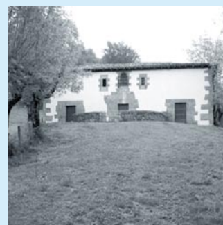
Ermita de Huici