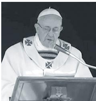
El Papa leyendo su homilía en la misa de inauguración de su pontificado

El papa Francisco no es un personaje aislado, ni el espectacular remate de una construcción acabada. Es eslabón en una cadena que viene de lejos y se encamina a lo lejos. Dejé-