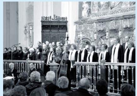
Los participantes en el concierto del 16 de diciembre en el Pilar

Desde el pasado día 6 hasta mañana día 9 realizan un viaje a Praga , capital de Chequia, donde hoy intervendrán en un concierto de villancicos. Cerrarán el mes con la misa en el Pilar el domingo 15 a las 12 h. Durante Navidad actuarán en la parroquia en la misa del Gallo y en la misa parroquial del día 25 , y el viernes 27 ofrecerán un Oratorio de Navidad a las 19,30 h. en el templo.