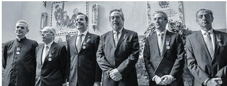
El alcalde con los galardonados