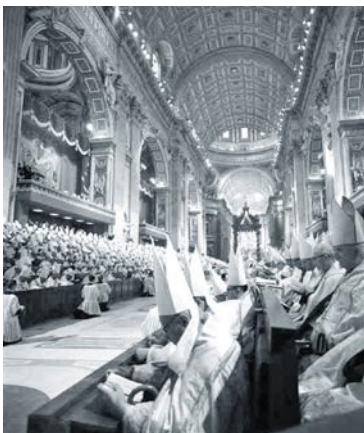
Imagen del Concilio Vaticano II

Los problemas de recepción han surgido del hecho de que se han confrontado dos hermenéuticas contrarias y se ha entablado una lucha.