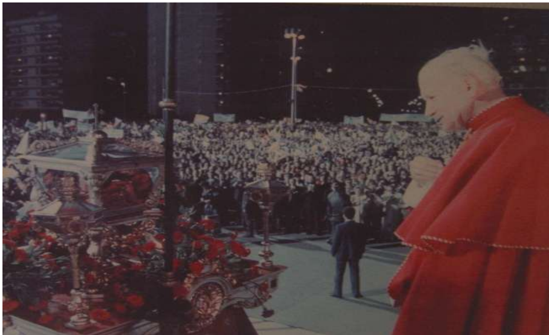
El beato Juan Pablo II junto a la urna de las Santas Masas en la Romareda. 6 de Noviembre de 1982