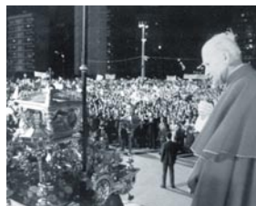
El beato Juan Pablo II junto a la urna de las Santas Masas en la Romareda. 6 de Noviembre de 1982