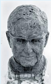
Cabeza de san Josemaría en cera

El ofrecimiento se realizó hace varios años; se estudió su ubicación; pero hubo que esperar, naturalmente, a que el Papa