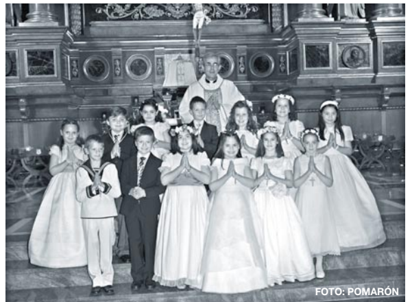
Confirmaciones del 5 de mayo