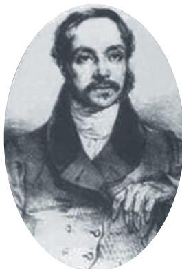
Siervo de Dios Santiago Masarnau

Las Conferencias están presentes en 148 países y ayudan a unos 37 millones de personas necesitadas (80.000 en España). En Zaragoza existe un Consejo Provincial de Zona (C/San Pablo, 42) y la Fundación Federico Ozanam (C/ Pignatelli, 17), además de Conferencias en varias parroquias. Entre ellas está Santa Engracia desde hace más de un siglo, por lo que es el grupo parroquial más antiguo. Nos reunimos los martes no festivos a las 6 de la tarde.