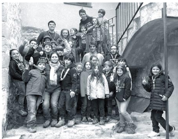
Los lobatos en Berge (Teruel)

El último trimestre todas las unidades han iniciado ya actividades el fin de semana del 12-14 de abril, incluidos los padres, que el viernes 12 tuvieron la tradicional cena anual, en la que hubo un sorteo con fines benéficos, cuya recaudación se destinará a Cáritas parroquial y al Banco de alimentos.