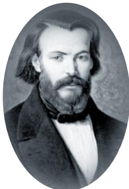
Bto. Federico Ozanam

Federico Ozanam "apóstol de la caridad, esposo y padre de familia ejemplar, gran figura del laicado católico del siglo XIX, fue un universitario que desempeñó un papel importante en el movimiento de las ideas de su tiempo" (Beato Juan Pablo II, homilía de la beatificación en París en 1997) y otros seis jóvenes universitarios fundaron la primera de las Conferencias en la iglesia de san Esteban de París el día de su veinte cumpleaños, con el apoyo de una Hija de la Caridad, la beata Rosalía Rendu. Ha sido nombrado uno de los patronos de la JMJ de Río de Janeiro en el próximo mes de agosto. En España la introdujo el siervo de Dios Santiago Masarnau en 1849, junto con otros colaboradores seculares, entre ellos el historiador aragonés (de Calatayud) Vicente de la Fuente.