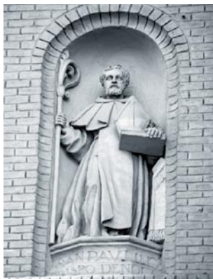
San Paulino de Nola