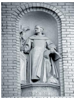
San Eusebio Cremonense