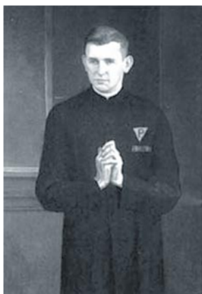
El beato Esteban Vicente Frelichowski