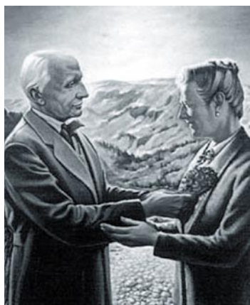
El beato Luis Beltrame Quattrocchi