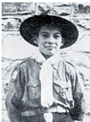
El beato Marcell Callo