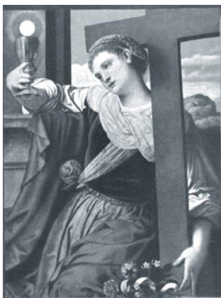
Allegoría de la fe. Moretto da Brescia (1530) Museo del Ermitage, San Petersburgo

La grandeza de la civilización occidental estriba en que esas respuestas no son el resultado de la observación y la reflexión de muchas generaciones; no son sabiduría humana. Son regalo de Dios, sabiduría divina.