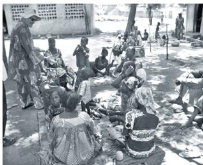
Saludando a un grupo de refugiados en la escuela de Béré

La situación que os describía en mi última carta ya no es la misma, por supuesto, pues las lluvias acabaron en noviembre (este año empezaron temprano y acabaron muy tarde). Al retirarse el agua de los ríos que se habían desbordado y acabarse las lluvias, la situación