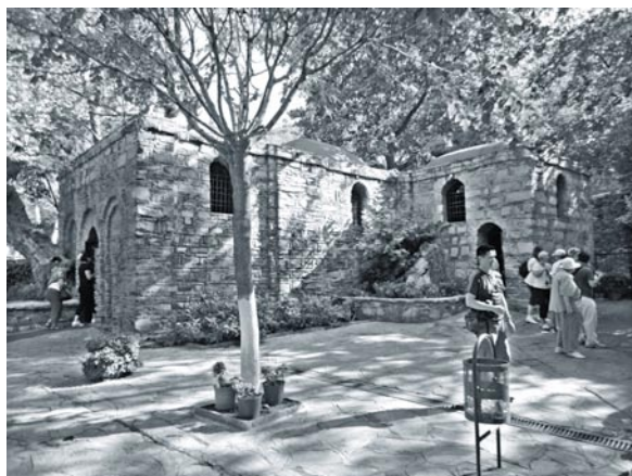
Éfeso. Casa de la Virgen

En ese lugar pudo ocurrir la dormición o muerte de Nuestra Señora y su ascensión en cuerpo y alma a los cielos. Pero también desde allí emprendió el viaje de