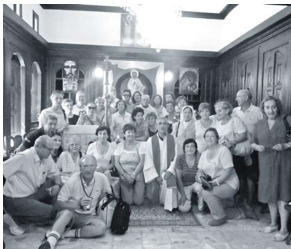
Antioquia de Siria