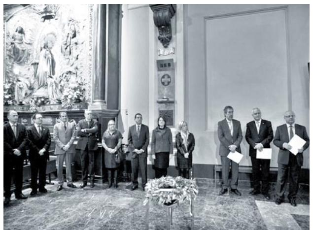
Un momento del homenaje a Zurita.