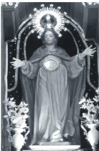
Virgen de la O Navas del Madroño (Cáceres)

Aquí están las antifonas. Aprópiate de la fe de María, meditándolas.