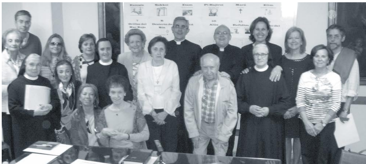
Los asistentes al grupo de Biblia durante este curso